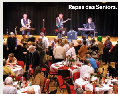
Repas des Seniors.