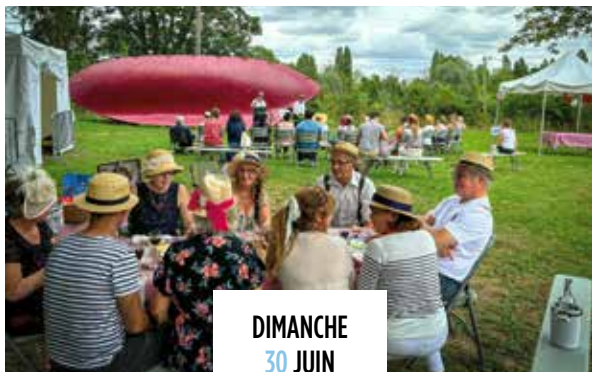
DIMANCHE 30 JUIN