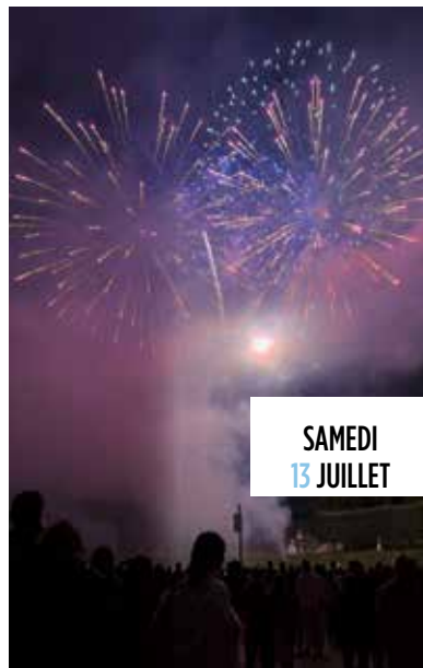
SAMEDI 13 JUILLET

L'anniversaire des 150 ans de l'Impressionnisme s'est poursuivi tout cet été avec un Cluedo géant, et le grand « Déjeuner sur l'herbe » organisé sur l'Île de la Loge. Une ambiance d'époque, robes à dentelles et canotiers, s'est installée avec plus de 80 participants, une intervention théâtrale et musicale, des jeux en bois, aussi d'époque... ●