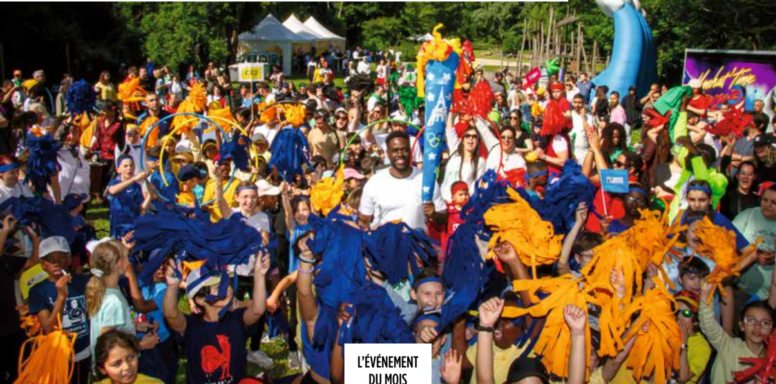
L'ÉVÉNEMENT DU MOIS

Le samedi 8 juin, la Fête de la Ville a pris les couleurs des anneaux olympiques ! Les enfants des Centres de loisirs se sont relayés au son d'une batucada pour porter leur flamme dans l'Île de la Loge ouvrant ainsi cette fête du sport. Cavale des Mousquetaires, stands ludiques des animateurs, démonstrations des associations et des bénévoles de l'Espace de Vie Solidaire, mais aussi intervention burlesque de la troupe des Rubafons ont animé cette journée sportive et familiale. ●