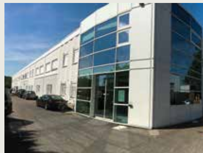
La pépinière de Montesson.

Plus d'infos : www.saintgermainbouclesdeseine.fr